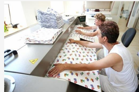
Clear servis o. p. s.