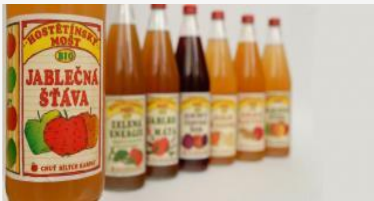
Moštárna Hostětín s.r.o.

Environmentální sociální podnik naplňuje společensky prospěšný cíl, kterým je řešení konkrétního environmentálního problému a zaměstnávání a sociální začleňování osob znevýhodněných na trhu práce.